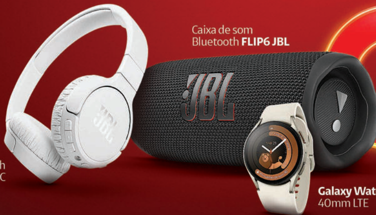
Headphone Bluetooth T660 JBL ANC

Aponte sua câmera para o QR Code Vá até uma loja | claro.com.br