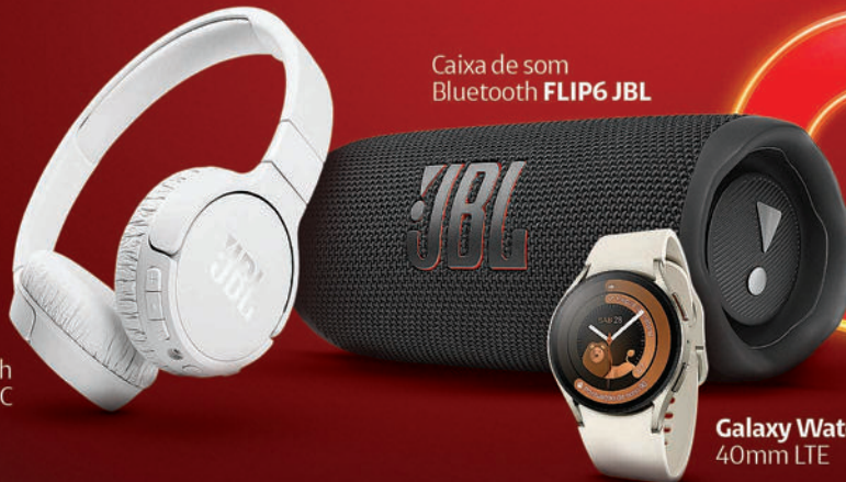
Headphone Bluetooth T660 JBL ANC

GARANTA JÁ O SEU: Aponte sua câmera para o QR Code Vá até uma loja | claro.com.br