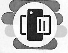
IMAGEM SOLUÇÕES EM IMPRESSÕES E INFORMÁTICA