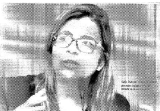
Carla Dickson, deputada federal do PDS/RN, destina mais de 40 milhões de reais em recursos para o RN.

A deputada federal Carla Dickson (PDS/RN) anunciou que destinará mais de 40 milhões de reais em recursos para o Rio Grande do Norte. O valor será usado para a construção de obras de infraestrutura, como estradas, pontes e saneamento básico. A deputada também anunciou que destinará recursos para a criação de empregos e para a melhoria da educação e da saúde pública no estado.