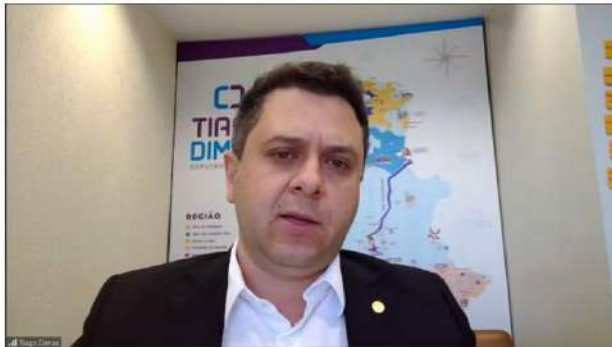
Tiago Dimas durante entrevista coletiva on-line nesta sexta-feira (16).

Em entrevista coletiva na tarde desta sexta-feira (16), o coordenador da bancada federal tocantinense, deputado Tiago Dimas (SD) falou sobre a representação no Tribunal de Contas da União (TCU) contra o edital do leilão da BR-153, no trecho entre Anápolis (GO) e Aliança (TO).