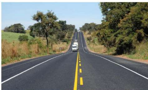
Duplicação da BR-153 no Tocantins está prevista para acontecer só em 20 anos.

Coordenador da bancada tocantinense no Congresso Nacional, o deputado federal Tiago Dimas (Solidariedade-TO) pediu, em ofício ao ministro da Infraestrutura, Tarcísio Gomes Freitas, suspensão para que seja feita a revisão imediata do Edital de Concessão nº 01/2021 da ANTT (Agência de Transporte Terrestre), que cede à iniciativa privada o direito de exploração da BR-153 entre Aliança (TO) e Anápolis (GO). Conforme o deputado, o edital tem indícios de tratamento discriminatório para o Tocantins, com prazos demasiadamente excessivos para a chegada dos benefícios no Estado. O ofício foi entregue nesta quarta-feira, 7 de abril.