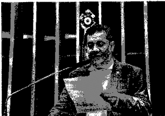
Severino Pessoa destina R$ 400 mil para a instalação da Embrapa em AL

O deputado federal Severino Pessoa (Republicanos/AL) destinou R$ 400 mil para a instalação de uma unidade da Empresa Brasileira de Pesquisa Agropecuária (Embrapa) em Alagoas. O recurso direcionado pelo deputado faz parte de uma emenda de bancada, somada em R$ 5.136.021.