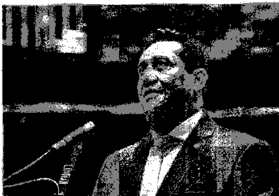
Severino Pessoa ressalta importância dos profissionais do rádio Associação

O deputado federal Severino Pessoa (Republicanos/AL) parabenizou todos os profissionais do rádio alagoano em relação ao Dia do Regionalista, comemorado nesta quinta-feira, dia 7 de novembro.