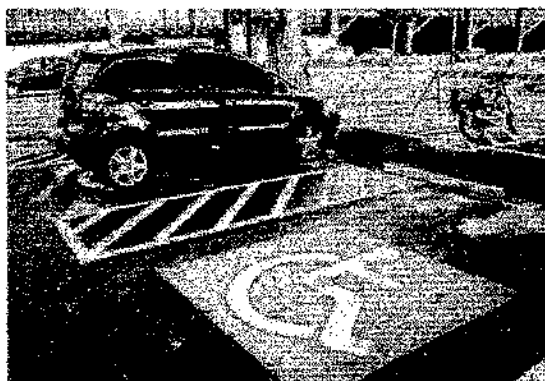
Severino Pessoa sugere gratuidade para deficientes em estacionamentos de shoppings e prédios comerciais Cartão

O deputado federal Severino Pessoa (PRB/AL) apresentou, na Câmara Federal, o projeto de lei número 1.832/2019 que sugere gratuidade nas vagas dos estacionamentos de shoppings, supermercados e prédios comerciais destinados às pessoas com deficiência ou comprometimento de mobilidade.