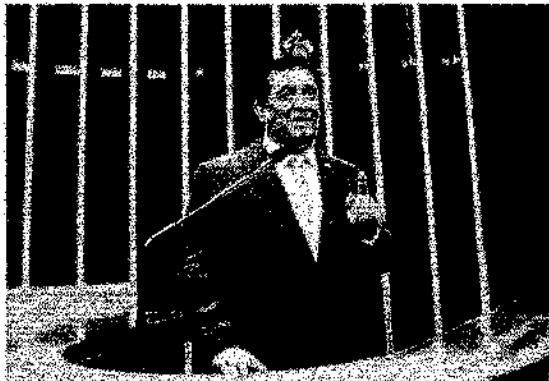
O projeto de lei quer isentar o Imposto Sobre Produtos Industrializados (IPI)