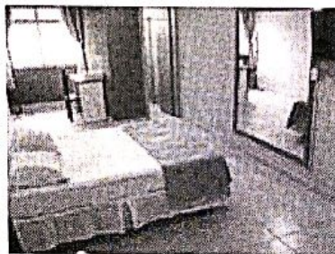
Dok Brasília Hotel - Unidade Taguatinga