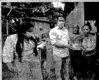
Ramos captou doações da iniciativa privada pra prevenção a Covid