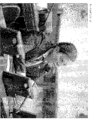
Deputado Marx Beltrão

O município de Feliz Deserto, distante 120 quilômetros de Macaé, já tem em sua conta corrente mais R$ 373 mil para investimentos em saúde. Os valores foram garantidos pelo deputado federal Marx Beltrão (PSD), que os anunciou na manhã desta quinta-feira (30) por meio de suas redes sociais. "Fico muito feliz por ter conquistado estes recursos para a saúde de Feliz Deserto e vamos seguir trabalhando por este município e pelos demais 102 municípios de Alagoas", afirmou o parlamentar.