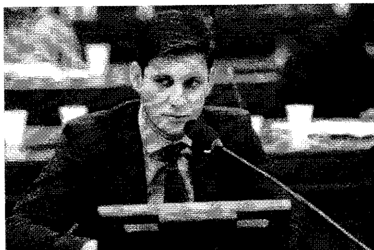
Câmara dos Deputados

O deputado federal Rafael Motta (PSB/RN) enviou ofício ao ministro da Economia, Paulo Guedes, nesta quarta-feira (20), solicitando a abertura de uma ação específica dentro do Orçamento 2021 para destinação de emendas parlamentares para aquisição de insumos para a vacina contra a Covid-19.