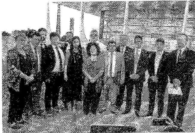
Por Aron Siqueira