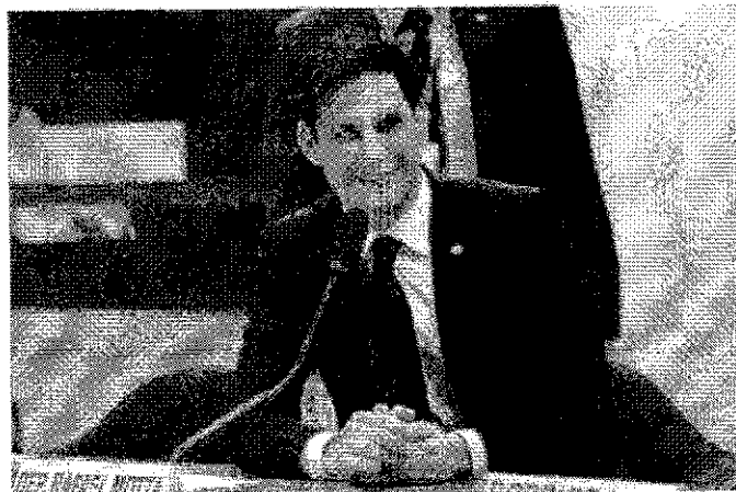
Por Anna Ruiz do Bureau Federal Co. RI, Sindicato