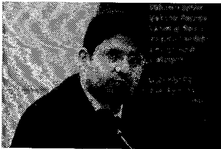
Deputado Federal Hissa Abrahão

Hissa Abrahão ressaltou que as empregadas domésticas deram mais um passo na conquista dos seus direitos como seguro-desemprego, indenização por demissão sem justa causa, pagamento de horas extras, adicional noturno, entre outros. “Essa emenda aprovada no plenário é de suma importância para a classe doméstica que, no passado, já enfrentou problemas trabalhistas”, frisou. Hissa