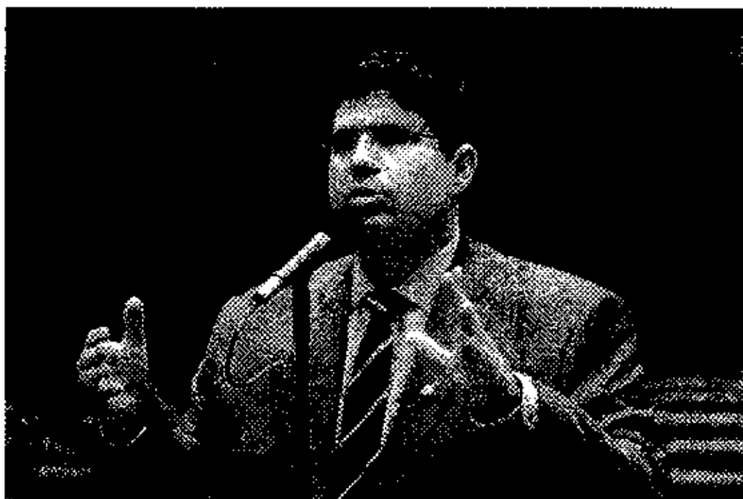
Deputado Federal Hissa Abrahão

O deputado federal Hissa Abrahão votou a favor da emenda substitutiva do projeto de lei complementar 302/13, que regulamenta os direitos e deveres da empregada doméstica. A votação (319 votos a 2) no Congresso Nacional.