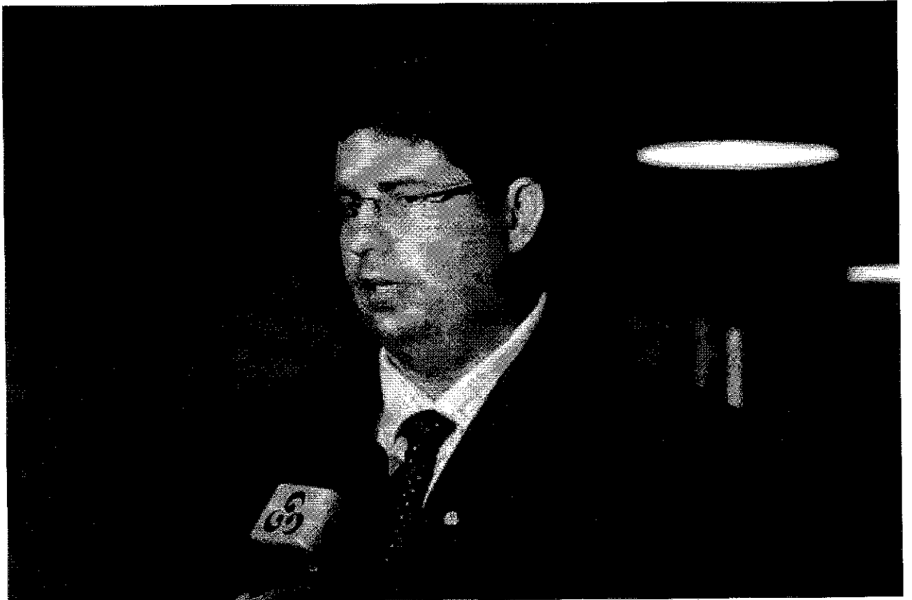
• Deputado Federal Hissa Abrahão-AM, Fotos / L Barbosa.