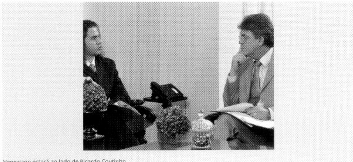
Veneziano estará ao lado de Ricardo Coutinho

O deputado federal Veneziano Vital do Rêgo (PMDB) confirmou que participará, na manhã desta segunda-feira, da inauguração da estrada que liga Campina Grande ao distrito de Catolé de Boa Vista. Ele estará ao lado do governador Ricardo Coutinho (PSB). A obra tem uma extensão de 18 km e deve beneficiar mais de 350 mil habitantes da região.