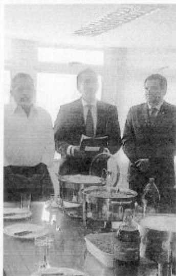
Governado do Estado do Amapá