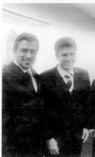
Ministro da Pesca