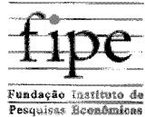
Tabela Fipe - Fundação Instituto de Pesquisas Econômicas - Fipe