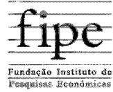
Tabela Fipe - Fundação Instituto de Pesquisas Econômicas - Fipe