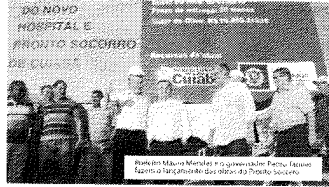
Deputado Fábio Garcia em visita ao novo Hospital São Benedito em Curitiba, acompanhado pelo prefeito Mauro Mendonça e pelo governador Pedro Taques.

O deputado federal Fábio Garcia realizou a destinação de 50% do valor de suas emendas parlamentares à construção do novo Hospital São Benedito em Curitiba. O anúncio foi feito ao prefeito Mauro Mendonça e ao governador Pedro Taques. Os outros 50% serão destinados para a área de saúde, divididos entre mais de 40 municípios do estado.