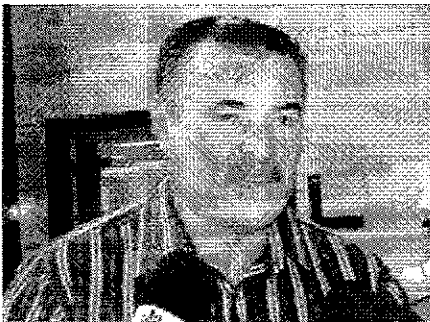
Cícero Almeida em foto de arquivo

O deputado federal Cícero Almeida (PSD) disse nesta terça-feira, 16, que aguarda com muita expectativa a apresentação do relatório da Comissão Especial da Reforma Tributária, que realiza reunião nesta quarta-feira, 17, para apresentação, discussão e votação do relatório do deputado André Moura (PSC/SE).