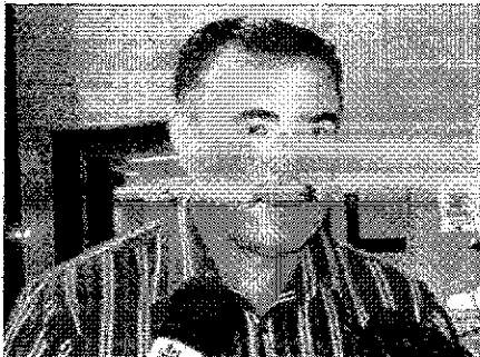
Cícero Almeida - Maceió - Alagoas

O deputado federal Cícero Almeida disse nesta quinta-feira, 25, na Câmara dos Deputados, que o Brasil não aguenta mais brigas políticas de lideranças políticas e que todos deveriam ter a consciência de que o País precisa andar e fazer a economia crescer, uma vez que a população está sofrendo as consequências dos embates políticos no Congresso Nacional.