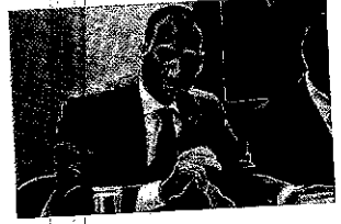
Dep. Eduardo Bolsonaro em Audiência pública sobre a obrigatoriedade de os interessados comprovarem o cumprimento da Lei de Cotas das vagas destinadas às pessoas com deficiência como requisito de habilitação nos processos licitatórios. (30/11/2016)

Hospital do Câncer de Barretos e Associação PRO-HOPE de apoio à criança com câncer, são algumas das entidades beneficiadas com destinação de recursos.