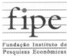
TABELA FIPE - FUNDAÇÃO INSTITUTO DE PESQUISAS ECONÔMICAS - FIPE - PESQUISA COMUM