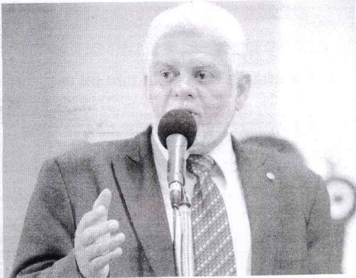
Zoinho mobilizou deputados no Rio de Janeiro para conseguir emenda

Pensando nesse elevado custo, o deputado federal Jorge de Oliveira, o Zoinho (PR), atendeu a solicitação do Consórcio e garantiu uma emenda de bancada no valor de R$ 39,5 milhões, que serão destinados para equipar a unidade. "O Cismespa me encaminhou um documento com a assinatura dos doze prefeitos solicitando a inclusão de uma emenda de bancada para a compra de equipamentos do hospital. Prontamente atendi o pedido, pois sei da importância do Hospital Regional para a região", disse o parlamentar. "Espero que a emenda seja um incentivo para que o governo dê celeridade a obra", completou.