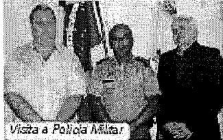
Visita a Polícia Militar