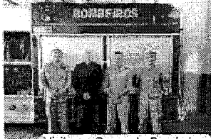
Visita ao Corpo de Bombeiros