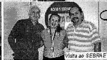
Visita ao SEBRAE