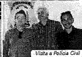
Visita a Polícia Civil