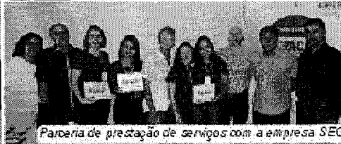
Parceria de prestação de serviços com a empresa SEG