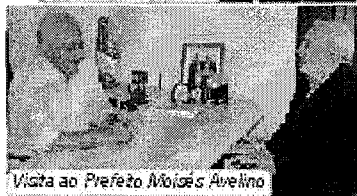
Visita ao Prefeito Moisés Avelino