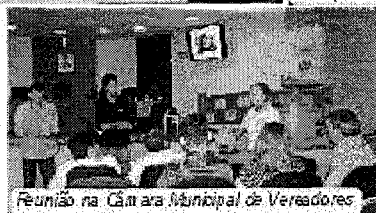
Reunião na Câmara Municipal de Vereadores