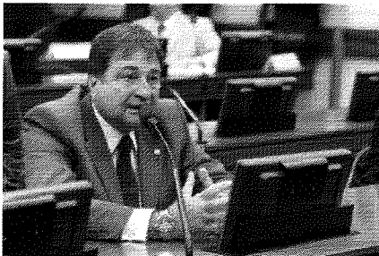
Deputado Federal César Halum (PRB-TO)

A Comissão de Defesa do Consumidor da Câmara aprovou, nesta quarta-feira (12), o requerimento do deputado federal César Halum (PRB-TO) para realização de audiência pública sobre o impacto da proibição ou da regulamentação do aplicativo UBER. O novo sistema tem gerado protestos por parte dos taxistas, já que para ser um motorista da UBER basta se cadastrar e seguir uma lista de exigências de segurança.