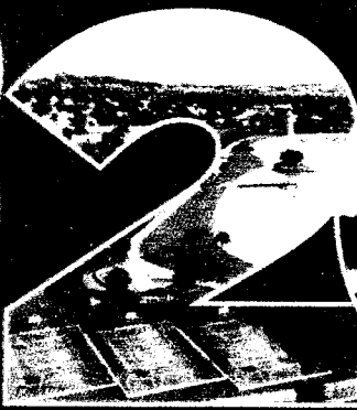
Parque Tia Nair