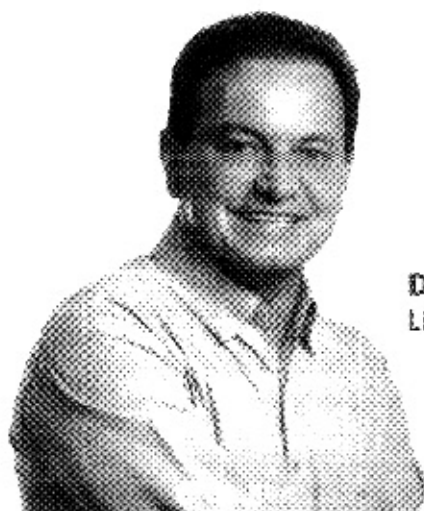
Deputado Aelton Freitas Líder do PR na Câmara dos Deputados