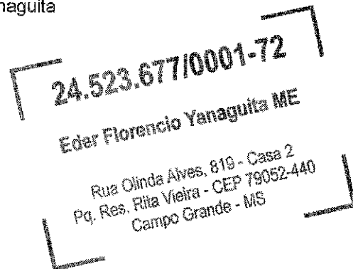
Éder Florêncio Yanaguita

Campo Grande (MS), 04 de fevereiro de 2019.