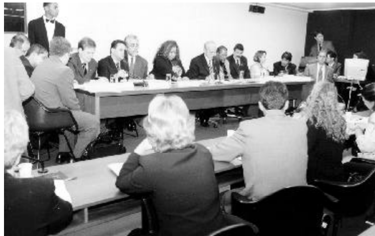
Artistas denunciaram conseqüências sociais da pirataria musical